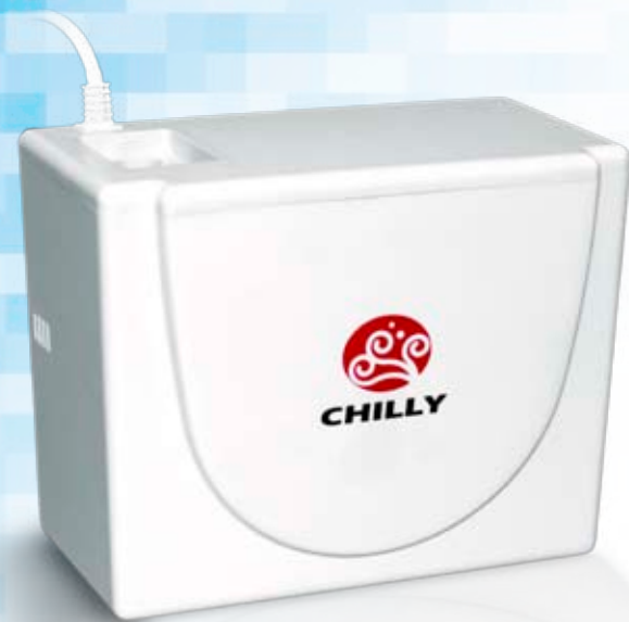
尺寸規格表 Size Specification